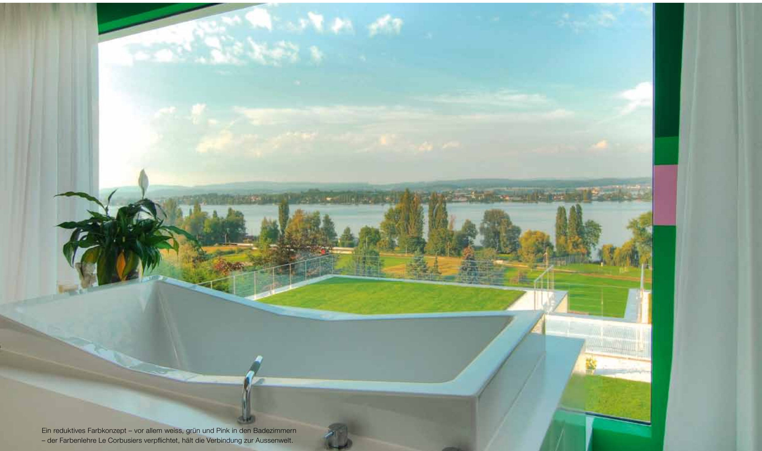
Ein reduktives Farbkonzept – vor allem weiss, grün und Pink in den Badezimmern – der Farbenlehre Le Corbusiers verpflichtet, hält die Verbindung zur Aussenwelt.