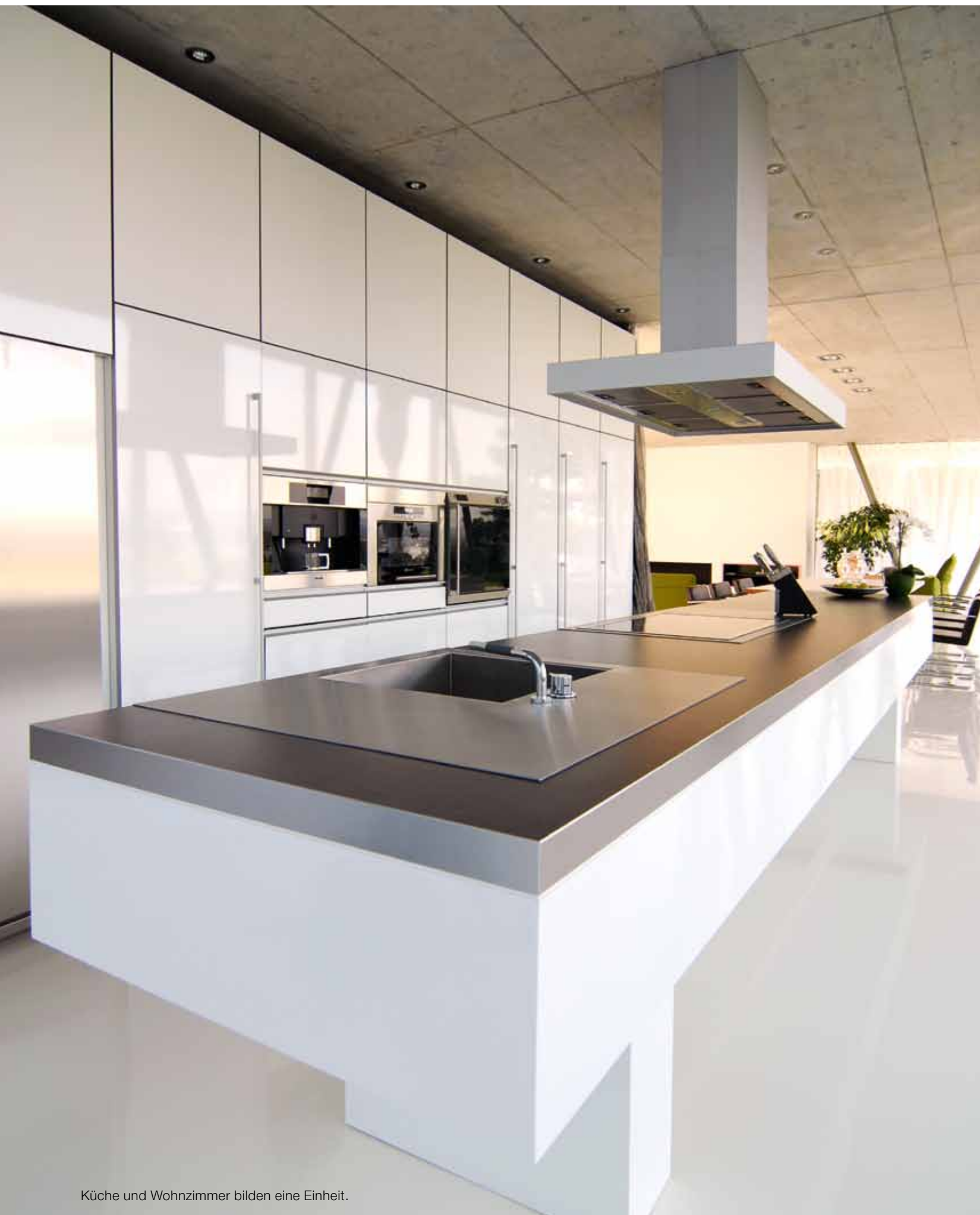
Küche und Wohnzimmer bilden eine Einheit.