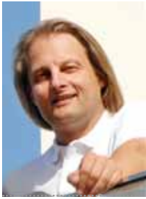
Heiko Ostmann Architekt tec ARCHITECTURE Swiss AG www.tecarchitecture.com