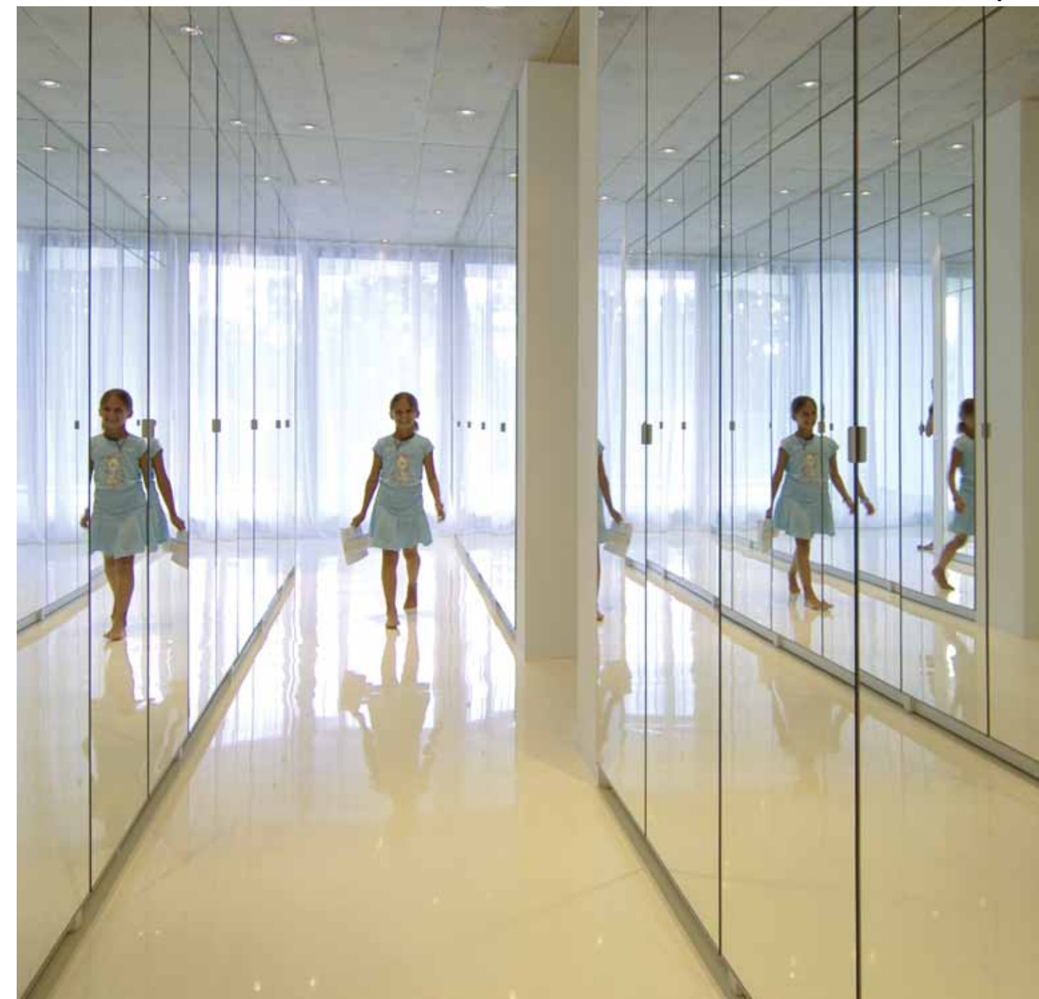
Im oberen Geschoss glänzt es wie in einem Spiegelabyrinth..

der Farbenlehre Le Corbusiers verpflichtet, die Verbindung zur Aussenwelt hält.